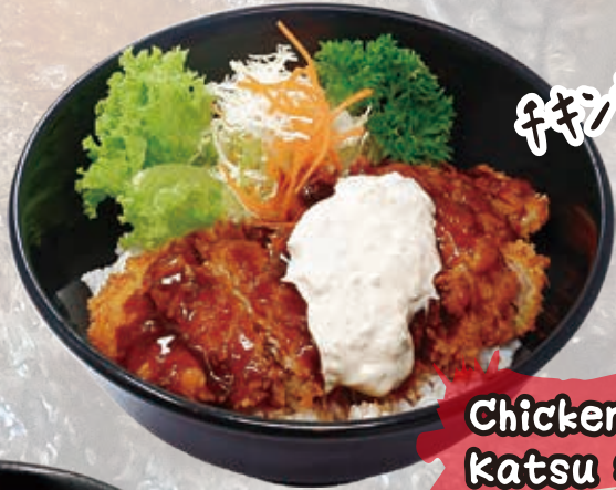
Chicken Katsu $16.8