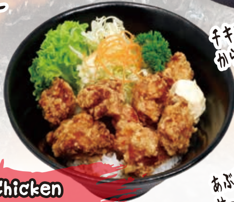
Chicken Karaage 14.8