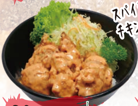
Spicy Chicken 15.6