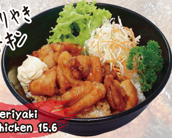
Teriyaki Chicken 15.6