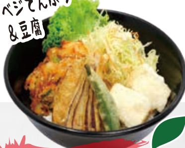
Vege Tempura & Teriyaki Tofu 14.8