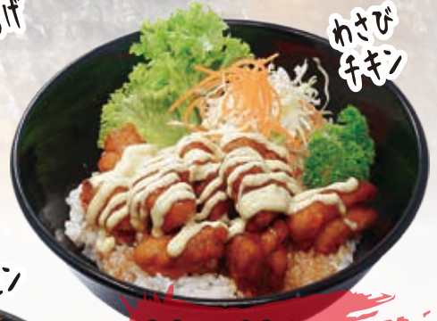
Wasabi Chicken 15.6