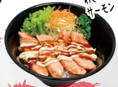
Wasabi Mayo Salmon 17.8