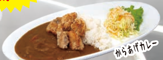
Chicken Karaage Curry 17.8