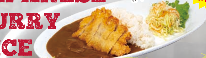
Chicken Katsu Curry 18.8