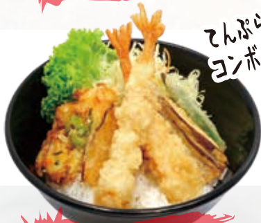
Tempura Combo 17.8