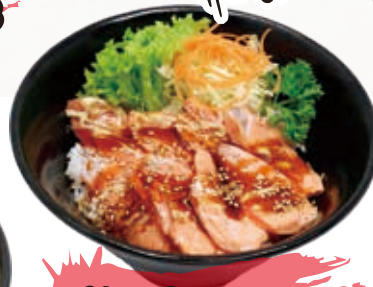
Aburi Salmon 17.8