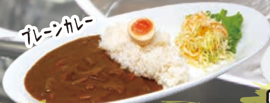
Japanese Curry 12.8