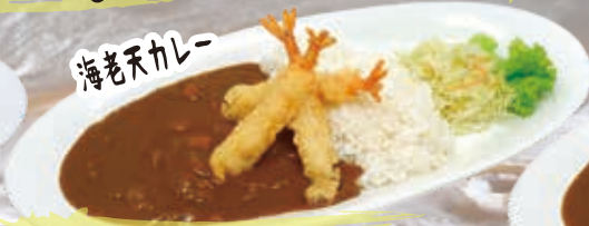
Prawn Tempura Curry 17.8