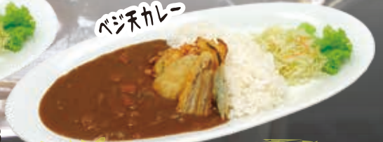
Vege Tempura Curry 16.0